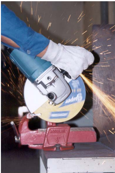
Operação de corte portátil

Nossos discos abrasivos são construídos de acordo com as normas da ABNT (NB 33 e PB 26) e ANSI , e são submetidos a testes físicos de resistência e rendimento para garantir Qualidade Total. No rótulo do disco abrasivo estão impressas informações relativas às condições seguras na utilização, tais como: EPI's necessários, posição de utilização, rotação de trabalho, etc